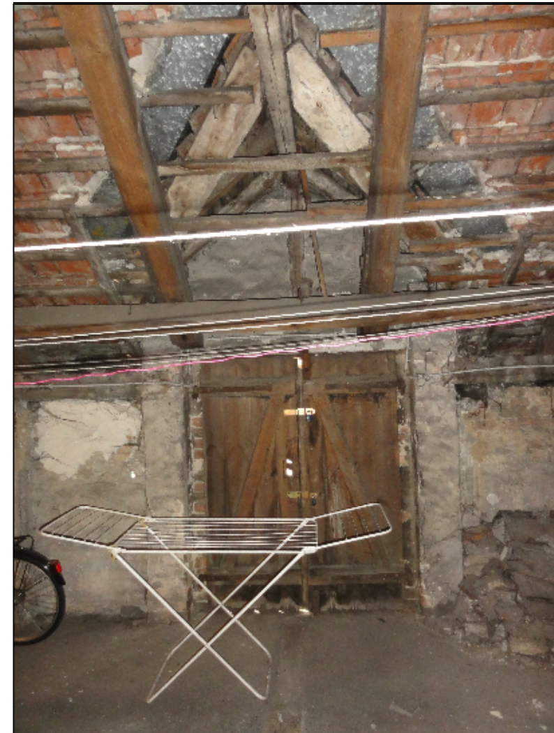
fol. Aktualny stan drzwiczek